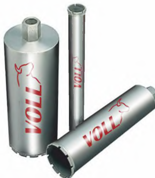
Алмазные сверлильные коронки NORMA

Под заказ изготавливаются коронки нестандартной длины и сегментами наиболее подходящими под индивидуальные требования заказчика.